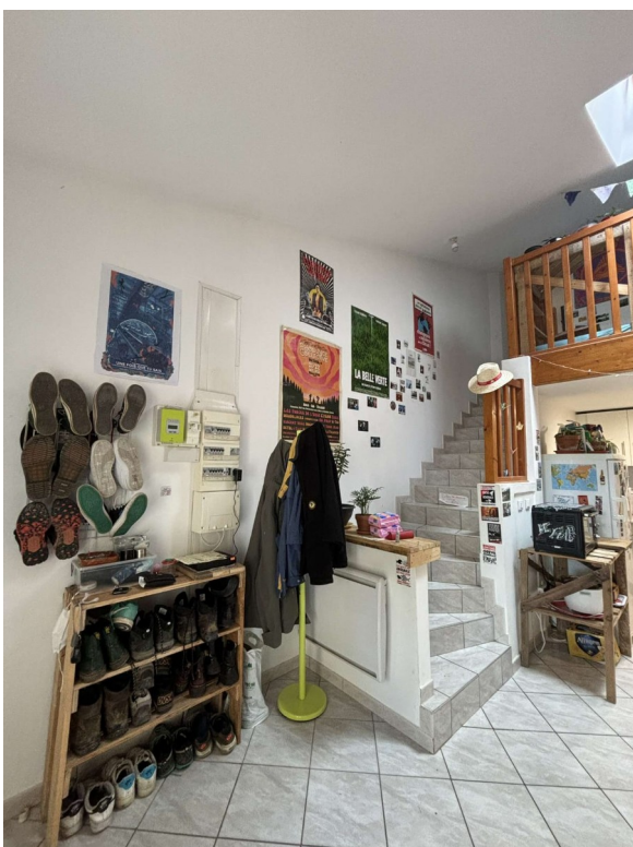
L'entrée et l'escalier