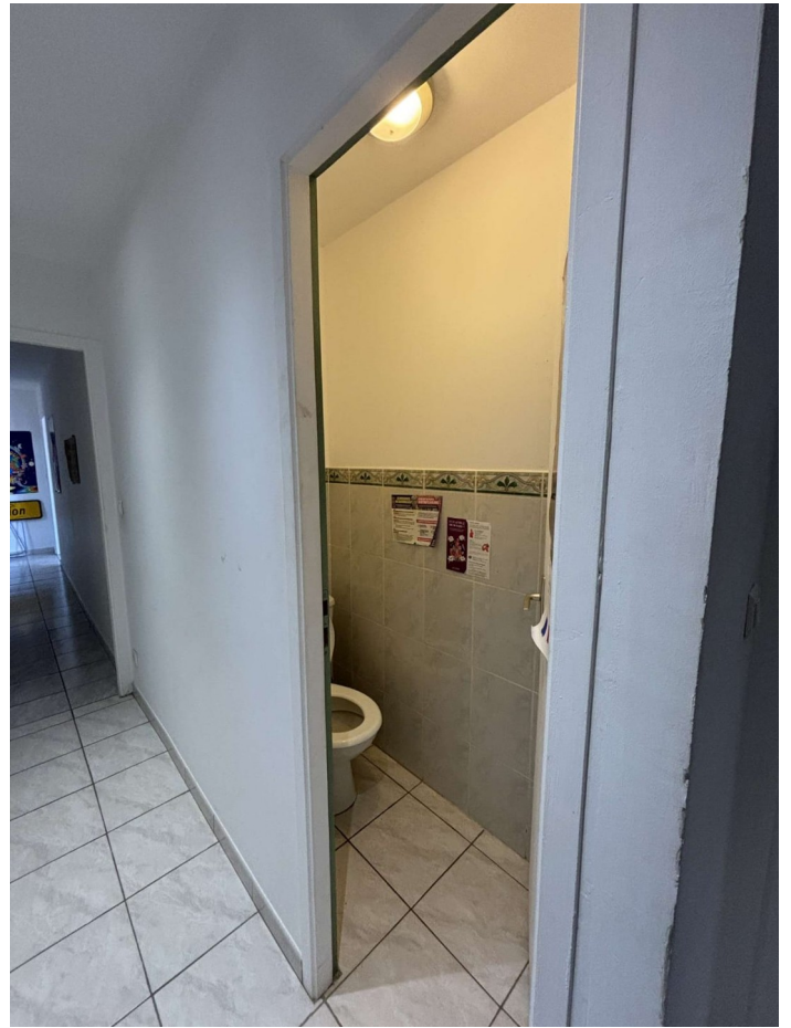
Toilette de l'étage