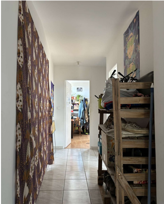
Le premier couloir