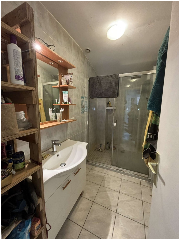
La salle de bain