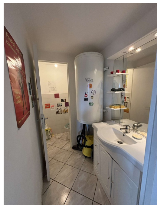
La "salle d'eau" et les toilettes du bas