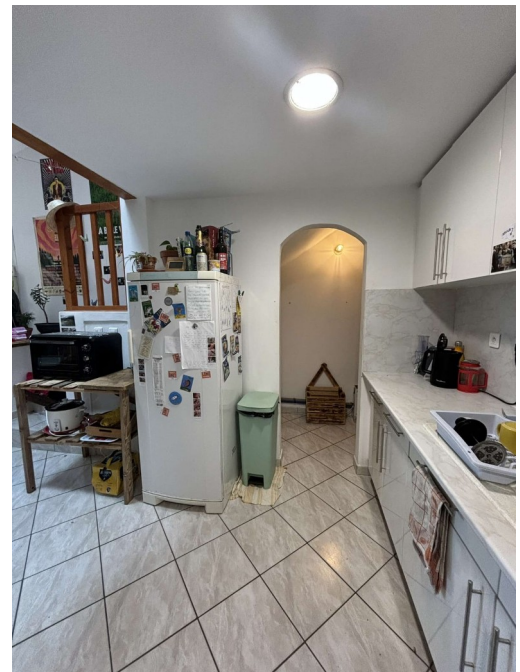
Cuisine avec le garde manger