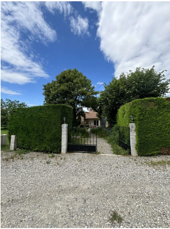
Devant de la maison