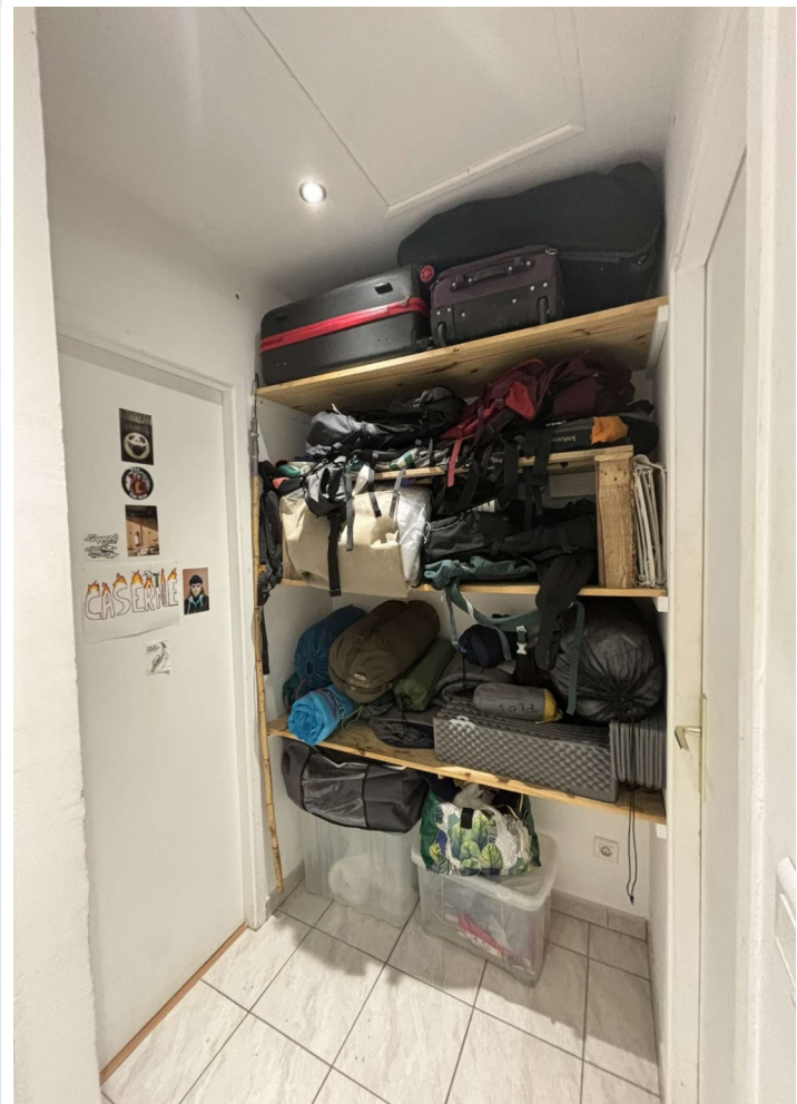
Rangement du fond du couloir