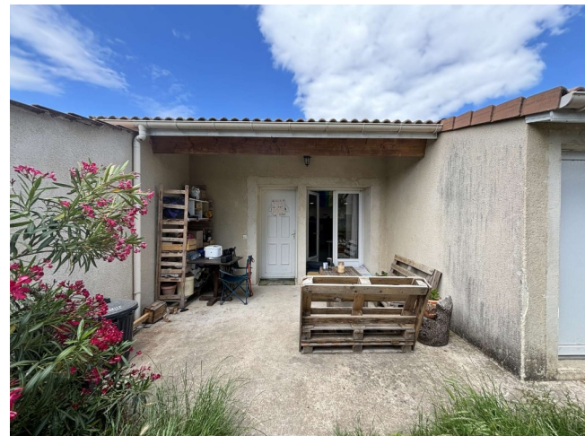
Terrasse du jardin