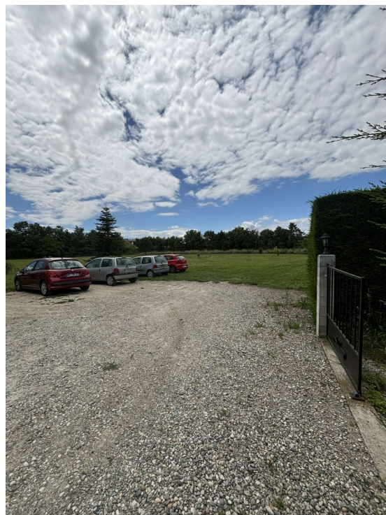
Champ-parking en face de la maison