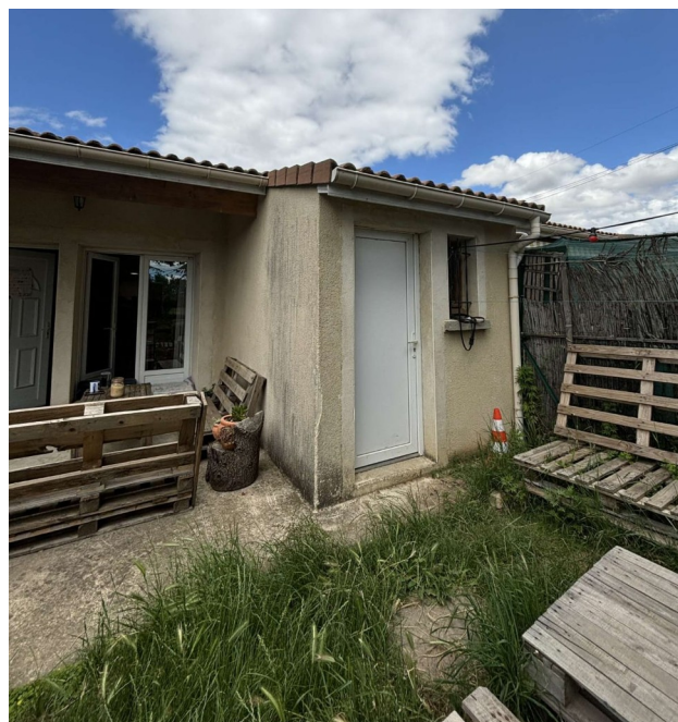
Pièce de stockage extérieur