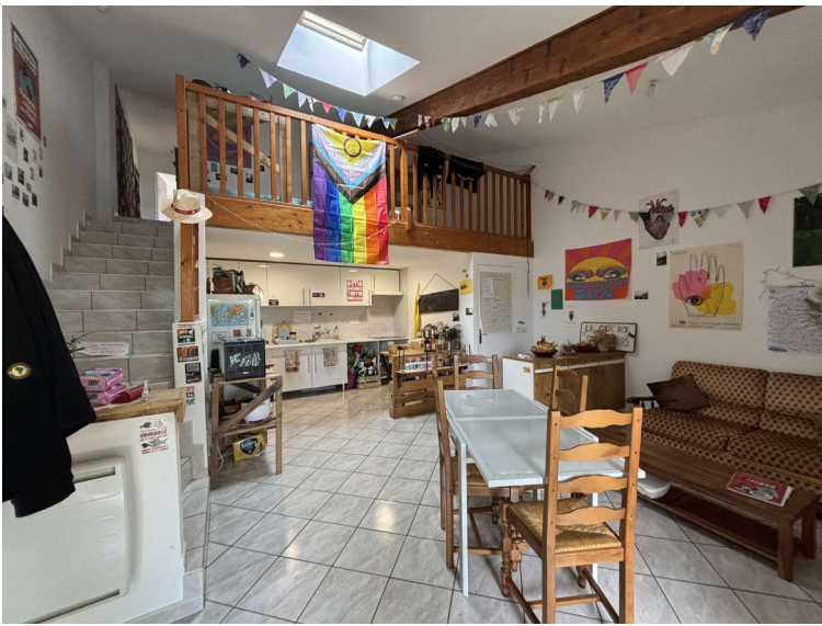
Grande pièce ouverte