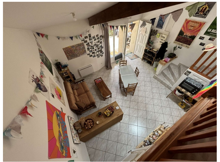
Salle à manger et salon vus de la mezzanine